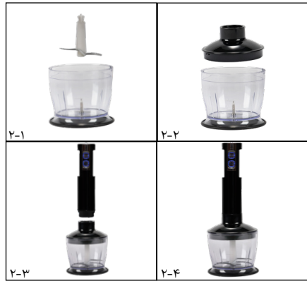
شکل شماره ۲