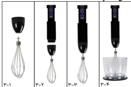
شکل شماره ۳

• از همزن تنها برای هم‌زدن خامه، سفیده تخم مرغ و مخلوط کردن مواد کیک اسفنجی و دسرهای نیمه آماده استفاده کنید. ۱. میله‌ی همزن را در نگاه‌دارنده‌ی آن قرار دهید. (مطابق شکل شماره ۱-۳) ۲. چرخ دنده را در بدنه بچرخانید تا قفل شود. (مطابق شکل‌های شماره ۳-۳ و ۳-۲) ۳. همزن را در ظرفی قرار دهید. ولوم تغییر سرعت را با توجه به سرعت مورد نیاز تنظیم کنید سپس شستی ON را فشار دهید تا دستگاه شروع به کار کند. (مطابق شکل شماره ۳-۴) ■ از همزن بیش از ۳۰ ثانیه به صورت ممتد استفاده نکنید.