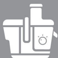
NS-918 Juicer Extractor